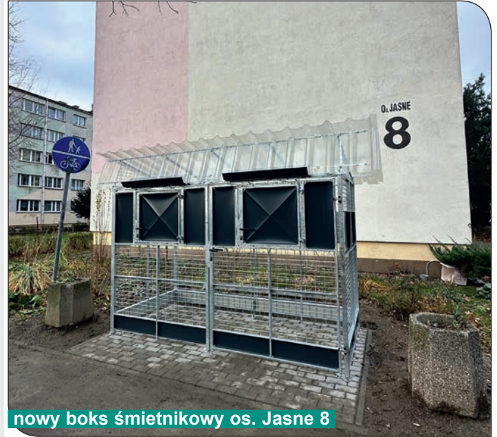
nowy boks śmietnikowy os. Jasne 8

Postawiono nowy boks śmietnikowy na os. Jasnym 8, wcześniej mieszkańcy korzystali z boku przy budynku os. Jasne 6.