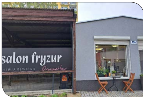
os. Różane 19g