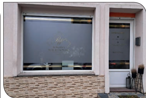
os. Różane 21g