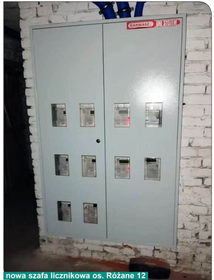
nowa szafa licznikowa os. Różane 12