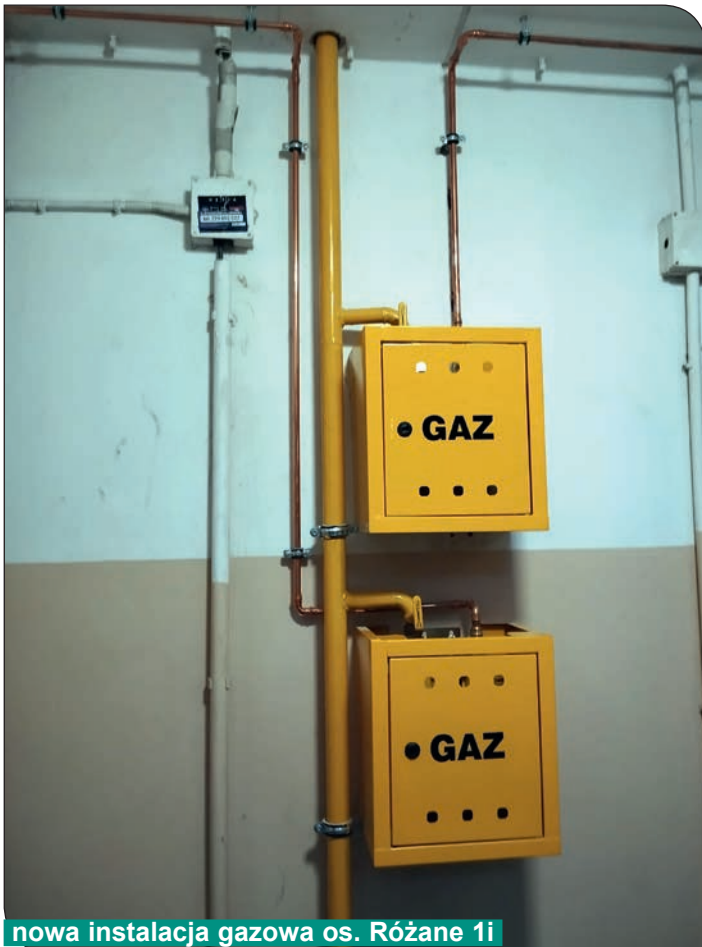
nowa instalacja gazowa os. Różane 1i